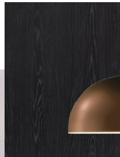
Front Structura, PG 3 403 Eiche Nero NB