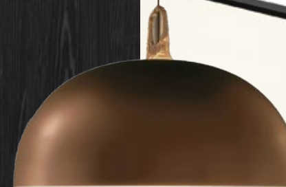
Griffleiste 807 Schwarz